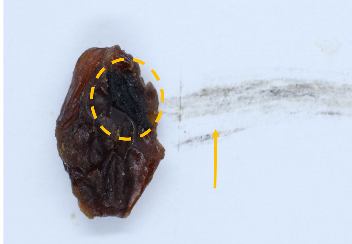
ПРОДУКТ С ПЛЕСЕНЬЮ