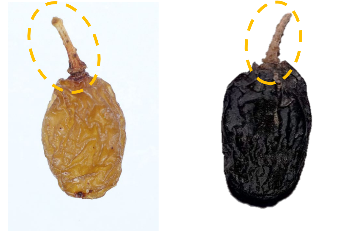
ПРОДУКТ С ПРИКРЕПЛЕННОЙ ПЛОДОНОЖКОЙ