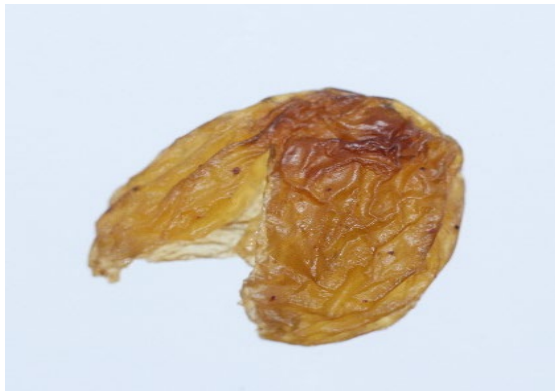
ПРОДУКТ С МЕХАНИЧЕСКИМИ ПОВРЕЖДЕНИЯМИ