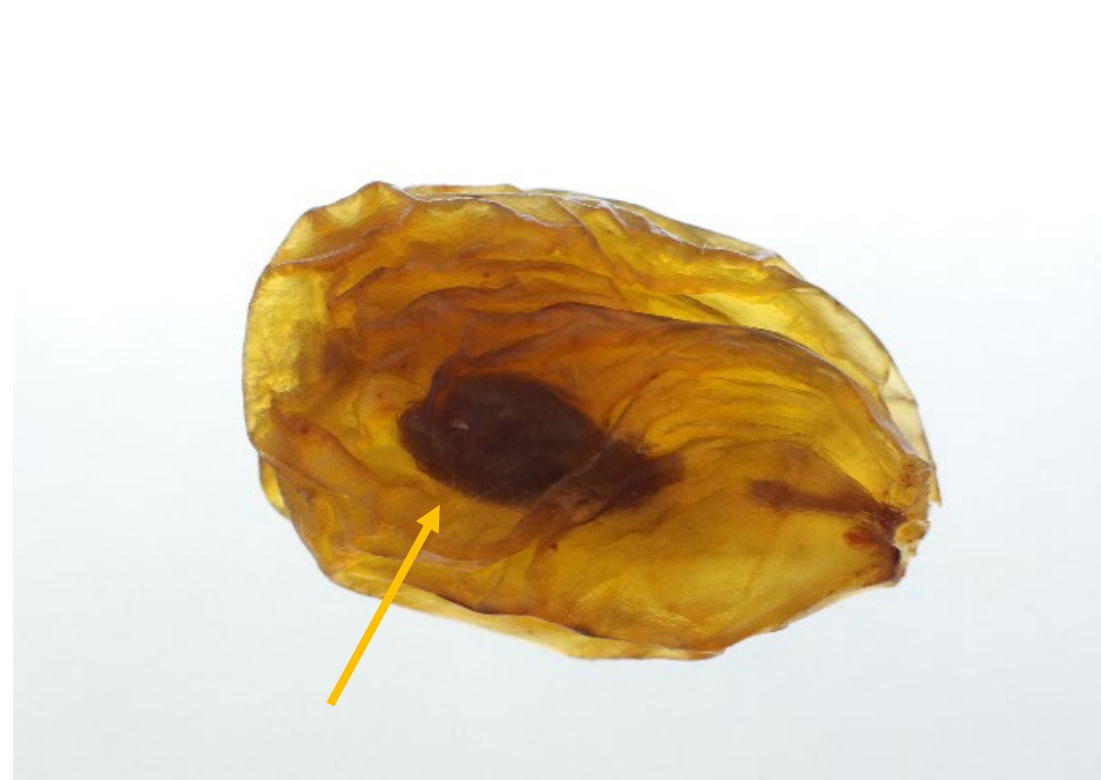
СОДЕРЖАТ СЕМЕНА СРЕДИ ЯГОД БЕЗ СЕМЯН