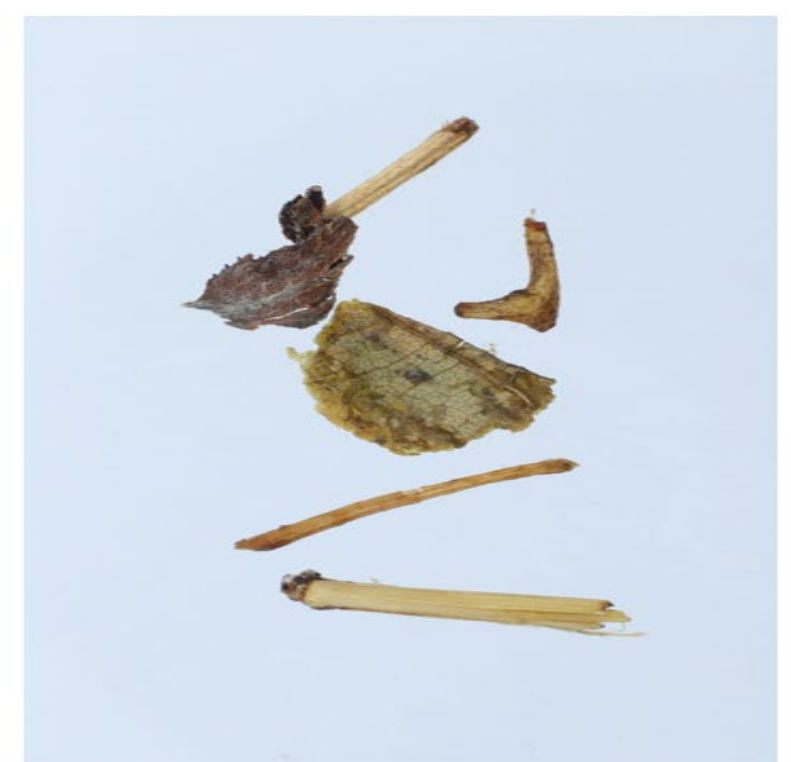
ОСТАТКИ СТЕБЛЯ / МИНЕРАЛЬНЫЕ ПРИМЕСИ / ПРИМЕСИ РАСТИТЕЛЬНОГО ПРОИСХОЖДЕНИЯ