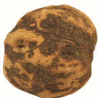
ПРОДУКТ С ПОВРЕЖДЕНИЯМИ