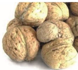
ПЛЕСЕНЬ НА СКОРЛУПЕ