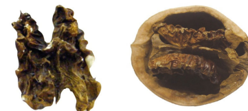
НЕДОСТАТОЧНО РАЗВИВШЕЕСЯ ЯДРО