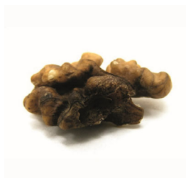
ПОВЕРХНОСТНЫЕ ПОРОКИ ЯДРА